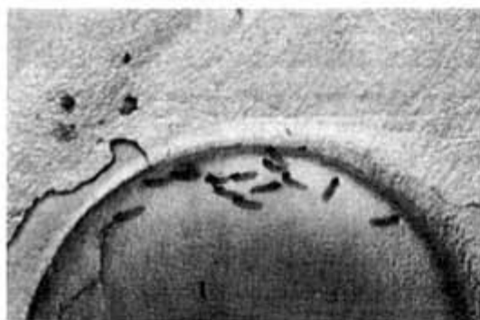
Fig.2. Cyrtorhinus lividipennis eggs which laid into carrageenan gel.

カタグロは滴下したカラジーンゲルの周縁部へ産卵した(Fig.2.)。Table 1に示すように平均産卵数はカラジーンゲル,イネ苗でそれぞれ4.6個,6.3個であり,カラジーンゲルへの産卵