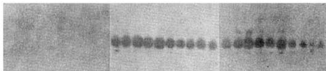
第2図 マラソンとスミチオン淘汰系統における E_7 泳動帯のエステラーゼ活性

このようにマラソンとスミチオンによる淘汰系統ではエステラーゼの E_7 泳動帯の活性の変化状態がかなり顕著に異なっていたが、いまそれぞれの系統における抵抗性の発達状態と E_7 泳動帯の活性