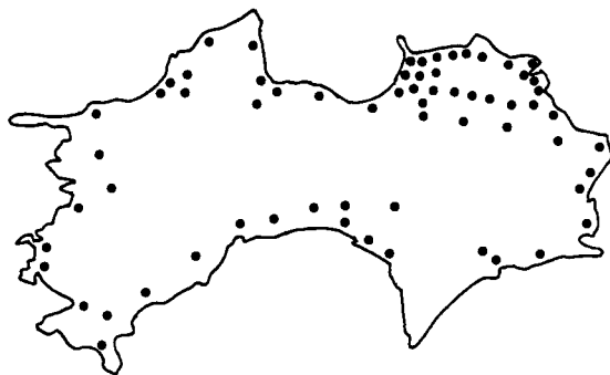
第1図 四国地域のソラマメのウイルス病発生状況調査地点

ウイルス病発生状況の調査および標本の採集は1990年の4月～5月と1991年3月～5月に行った。調査地はソラマメを多く栽培している瀬戸内海沿岸を中心に、66市町村の168圃場について行った(第1図)。また、標本の採集はウイルス症状を示したソラマメ130株を無作為にサンプリングし、 -80^{\circ}\text{C} で凍結保存し、病原ウイルスの検出に供試した。