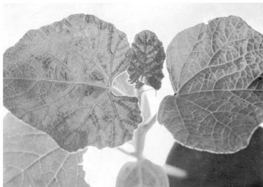
第1図 ユウガオの種子伝染による病苗